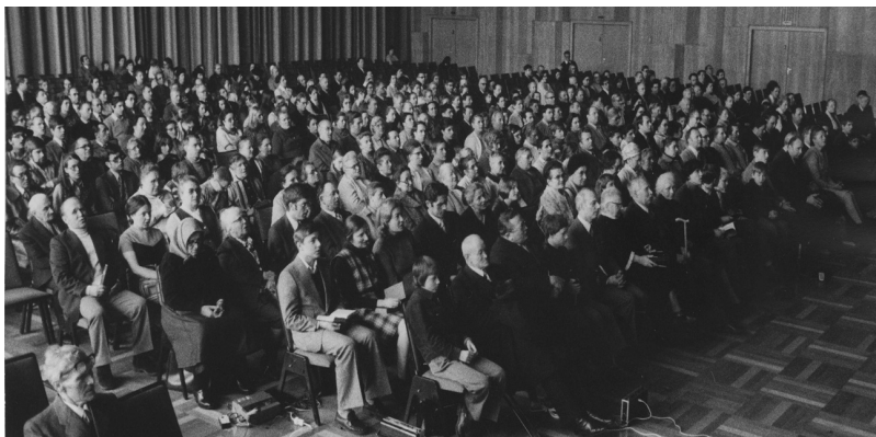
Собрание в Хайльбронне в пасхальную субботу 1975 года.