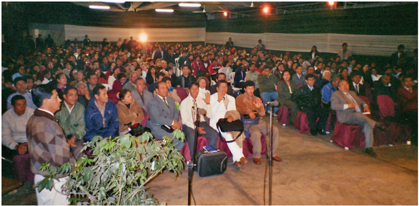
Собрание в Лиме (Перу) в октябре 2007 года