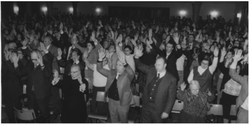
Собрание в Цюрихе в пасхальное воскресенье 1975 года.