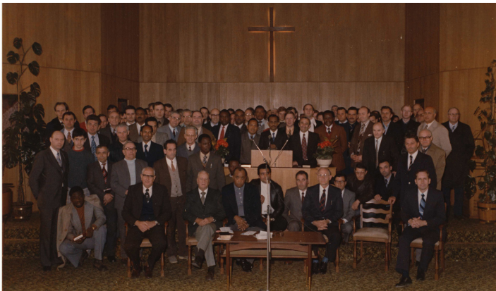
Международная братская конференция в 1976 г. на которой принимали участие проповедники из 33 стран.