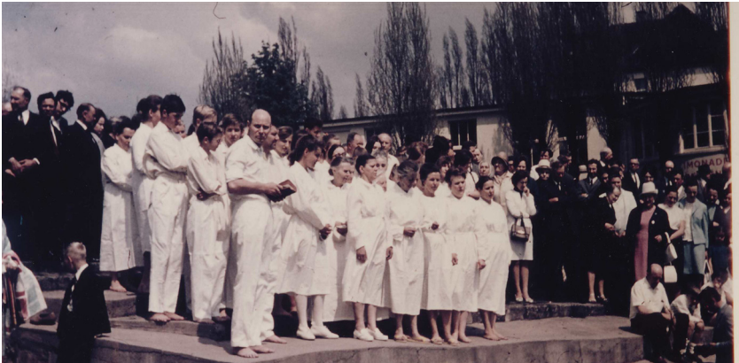
С 1966 года тысячи братьев и сестёр приняли водное крещение во имя Господа Иисуса Христа