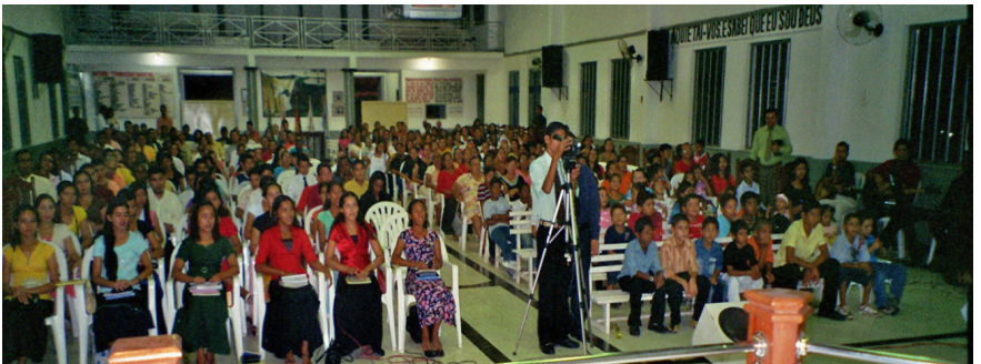
Собрание в Белеме (Бразилия) в октябре 2007 года.