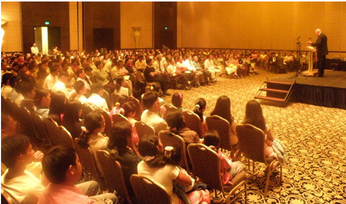
Собрание в Маниле (Филиппины) в сентябре 2008 года.