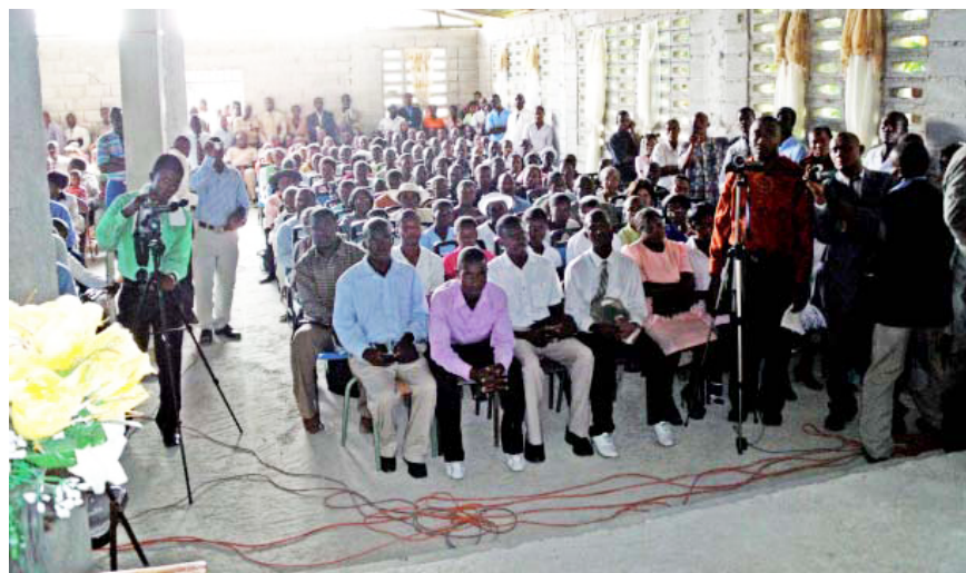
Une prise partielle de la réunion au Port-au-Prince, en Haïti le 14 Mars 2010