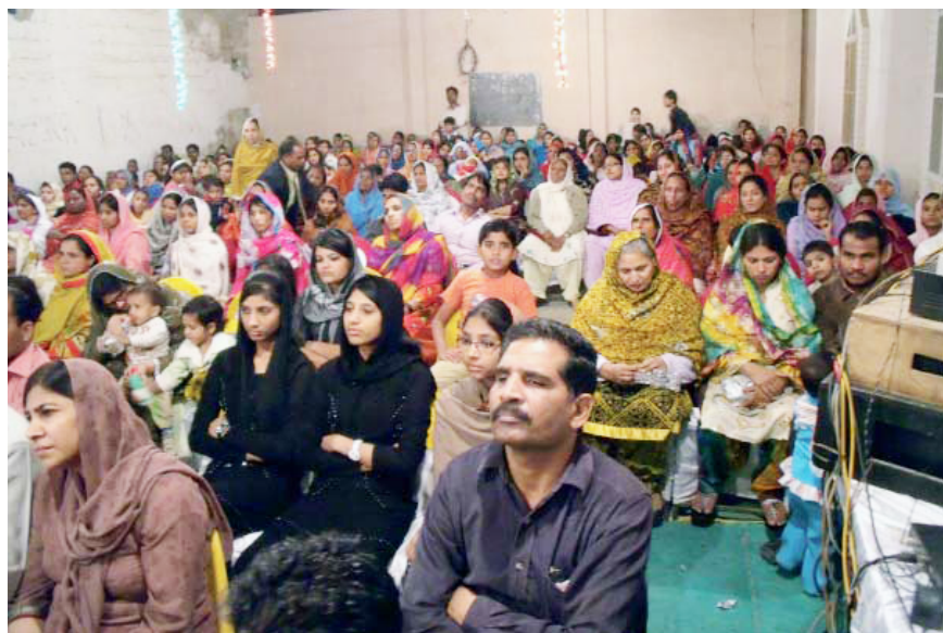
Une prise partielle de la réunion à Islamabad, au Pakistan le 20 février 2010