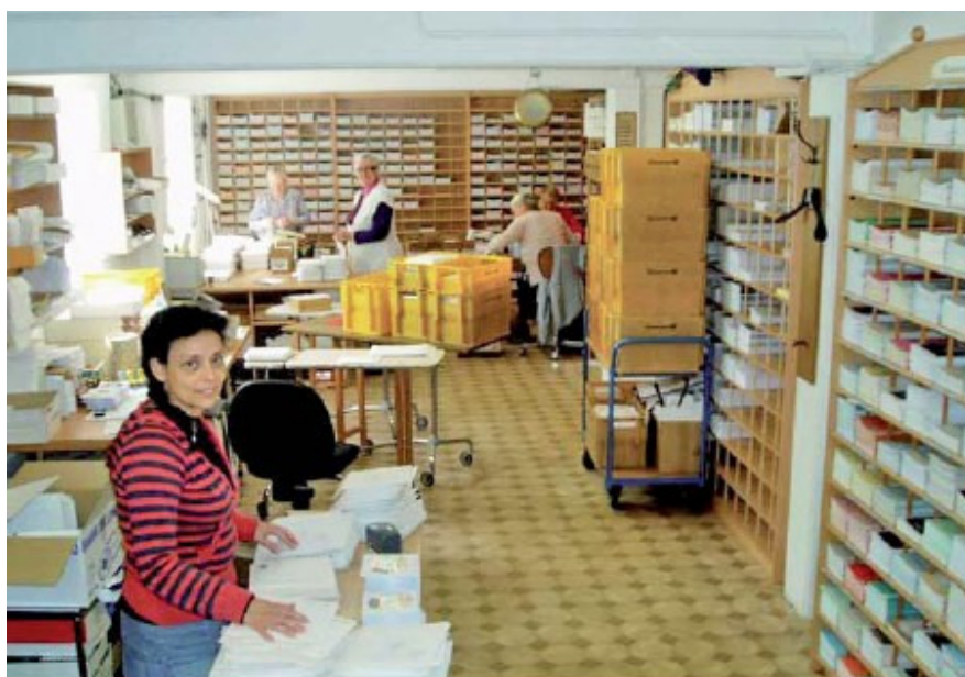
Una fotografia del nostro locale di spedizione

Le predicazioni del fratello Branham in lingua tedesca sono disponibili per tutti, inviate gratuitamente e vengono continuamente ristampate per la spedizione. Che si tratti di DVD, CD, cassette audio, libri o opuscoli, tutto viene spedito nel mondo gratuitamente. Io non ho in alcuna occasione fatto menzione di denaro nel corso di questi anni. Il fedele Signore ha provveduto per tutto, che si tratti della traduzione in 12 lingue, dei mezzi tecnici affinché il messaggio sia ascoltato e visto in tutto il mondo, del coro e l'orchestra, della stampa, dell'alloggio in occasione di ogni primo fine settimana del mese; in effetti Dio ha pensato a tutto.