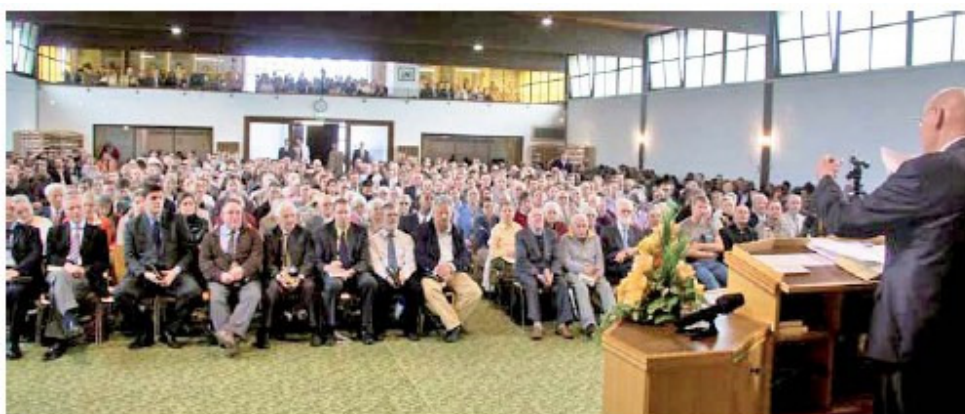
La riunione del 3 Aprile 2011 nel Centro Missionario di Krefeld

È possibile collegarsi via Internet alle nostre riunioni mensili che si svolgono ogni primo fine settimana del mese. Sabato sera alle ore 19:30 e la Domenica mattina alle ore 10:00. Gli incontri sono trasmessi in tutto il mondo in 12 lingue diverse. Prendete parte a ciò che Dio sta facendo ora secondo il Suo Piano di Salvezza.