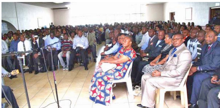
Une photo de la réunion à Johannesburg