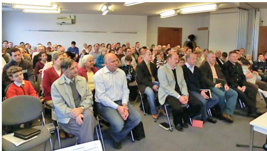
Une photo prise à Graz, en Autriche