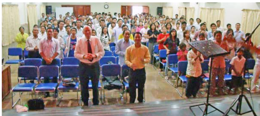
Une vue de Phnom Penh au Cambodge