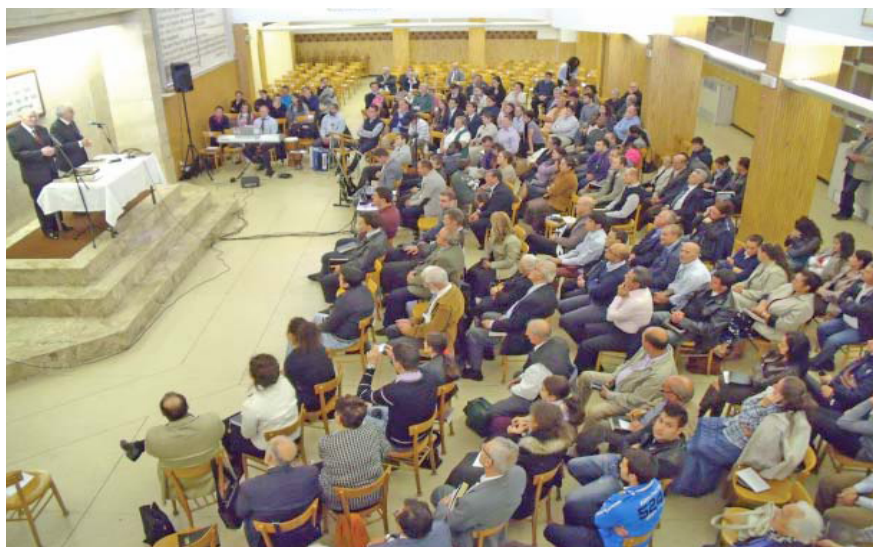
La réunion à Rome