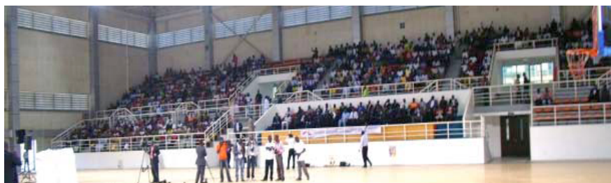
Cette photo montre une partie du rassemblement dans le stade de Luanda, en Angola