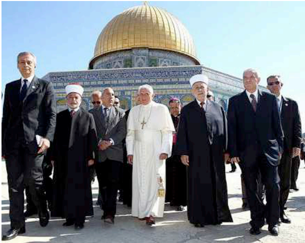
Fotografia pápeža a zástupcu Palestínčanov pred mešitou na Chrámovej hore