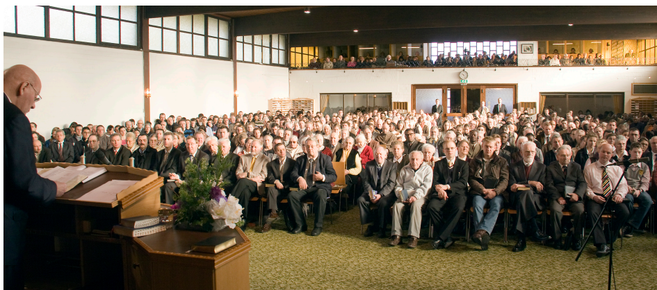
Snímka z 5. februára 2012 v misijnom centre v Krefelde