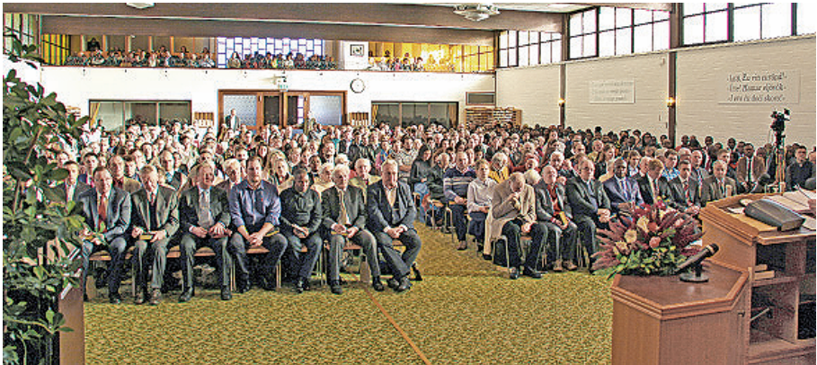
De vergadering op 4 december, 2016, in het Missionaris Centrum te Krefeld

Geliefde Heere Jezus, Gedenk het verbond dat U met ons hebt gemaakt, Het bloed dat U heeft vergiet voor ons, De belofte die U ons hebt gedaan, En geef uw erfgenamen , door genade, Uw eeuwig leven.