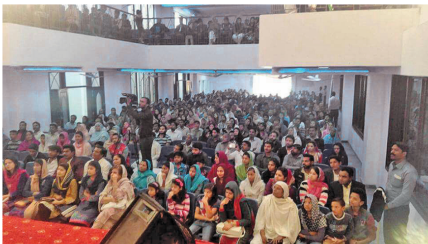
Deze foto toont de tweede vergadering in een kerk in Lahore, Pakistan