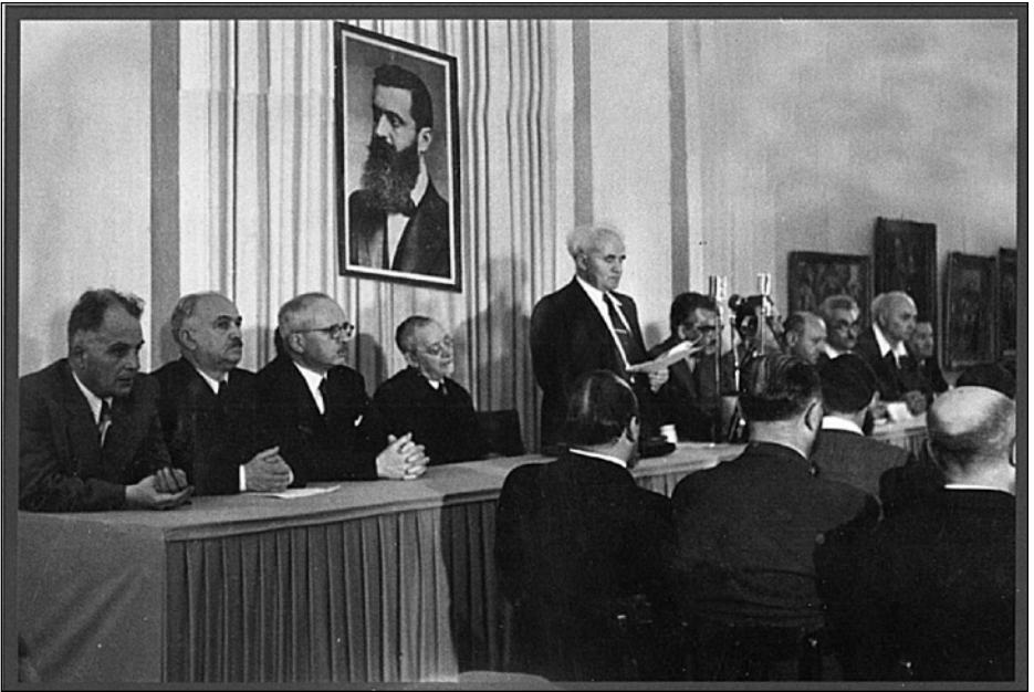
David Ben-Gurion akisema, utangazaji uhuru wa inchi ya Israeli.

“Maana BWANA atamuhurumia Yakobo, atamchagua Israeli tena, naye ata waweka katika nchi yao wenyewe ;atajiunga nao, nao wataambatana na nyumba ya Yakobo.” (Isa 14:1)