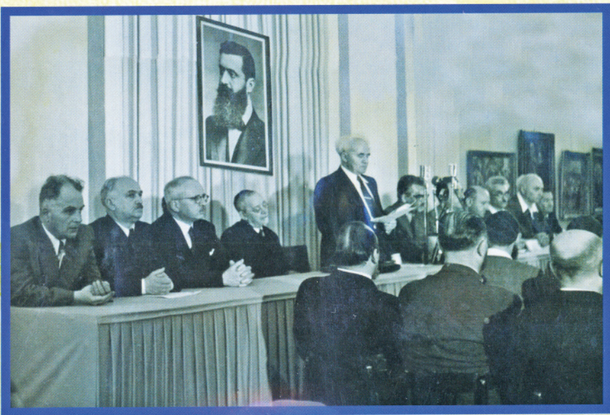
Tel Aviv am 14. Mai 1948 (5. Iyar 5708) David Ben Gurion verliest die Unabhängigkeitserklärung des Staates Israel

« Car l'Éternel aura pitié de Jacob, il choisira encore Israël, et il les rétablira dans leur pays » (És. 14:1).