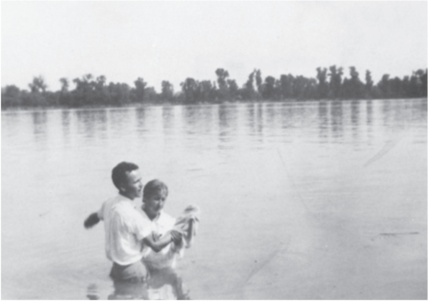
Le premier service de baptême de frère Branham dans le fleuve Ohio le 11 juin 1933