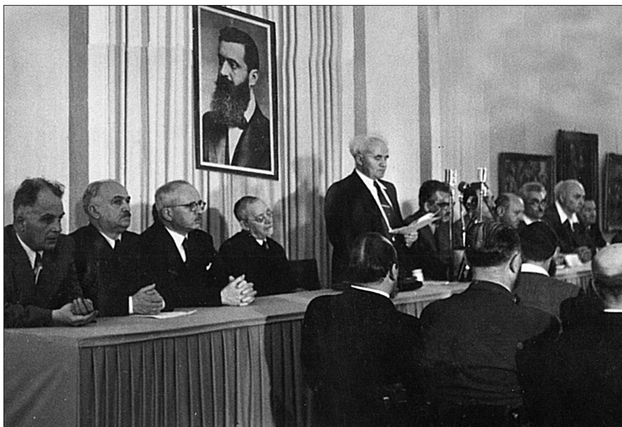
Tel Aviv, 14. mája 1948, David Ben Gurion číta vyhlásenie nezávislosti štátu Izrael.