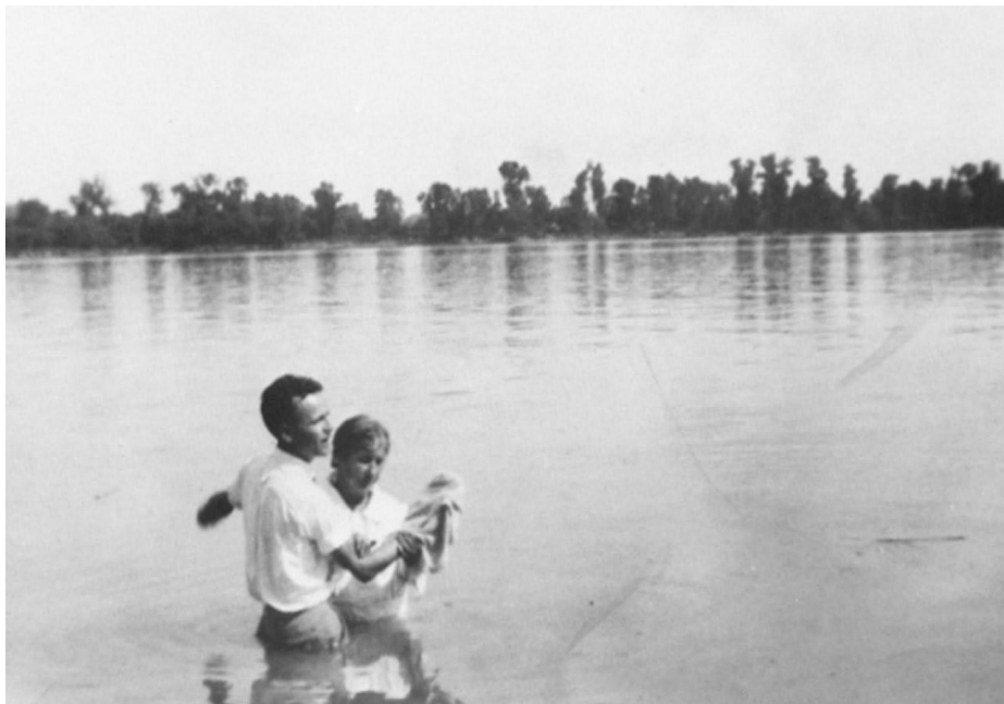
Fratele Branham la primul botez în fluviul Ohio pe 11 iunie 1933

DOMNUL Dumnezeu a dăruit și harul extraordinar ca eu să pot traduce predicile fratelui Branham și să scriu toate cărțile, broșurile și