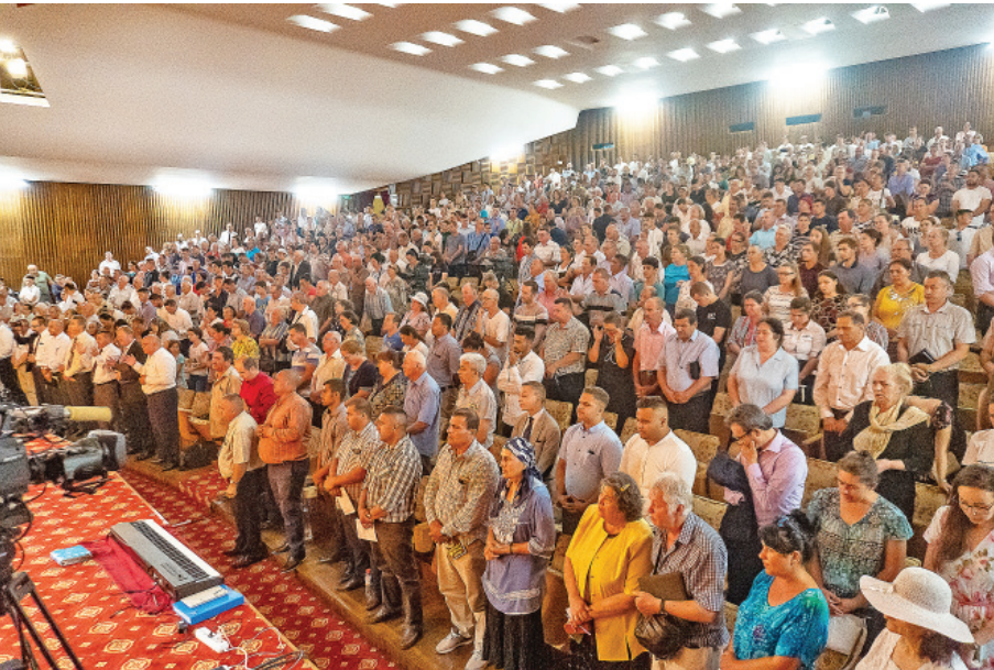
La réunion du samedi 22 juin 2019, en Roumanie