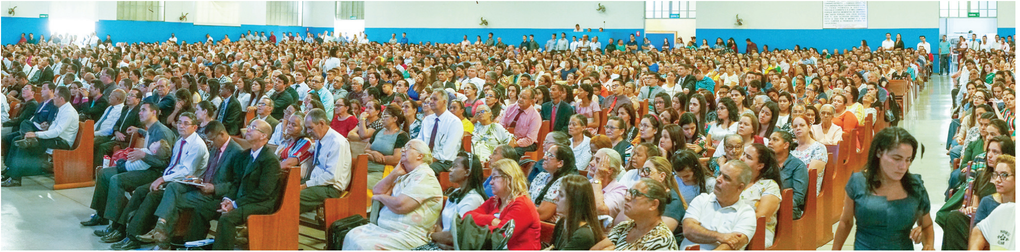
Le dimanche de Pâques, le 22 avril 2019, un grand nombre de croyants de tout le pays se sont rassemblés à Goiânia, au Brésil