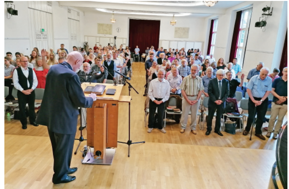
Une photo de Zurich, le dimanche 28 juillet 2019