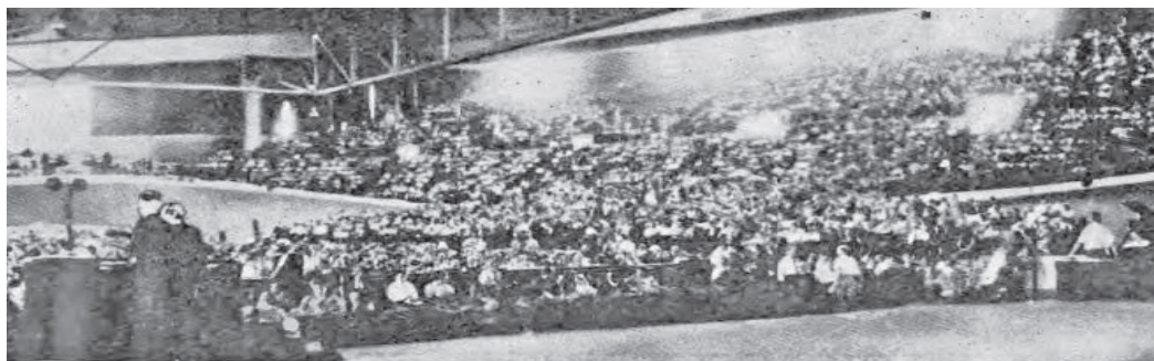
Hallen-Stadion in Zurich, Switzerland

In 1958 het ons, deur God se leiding, begin om van broeder Branham se preke op band te vertaal. So het die eerste onafhanklike plaaslike gemeente ontstaan, later ook die sendingwerk. Op 2 April, 1962, het ek deur die hoorbare stem