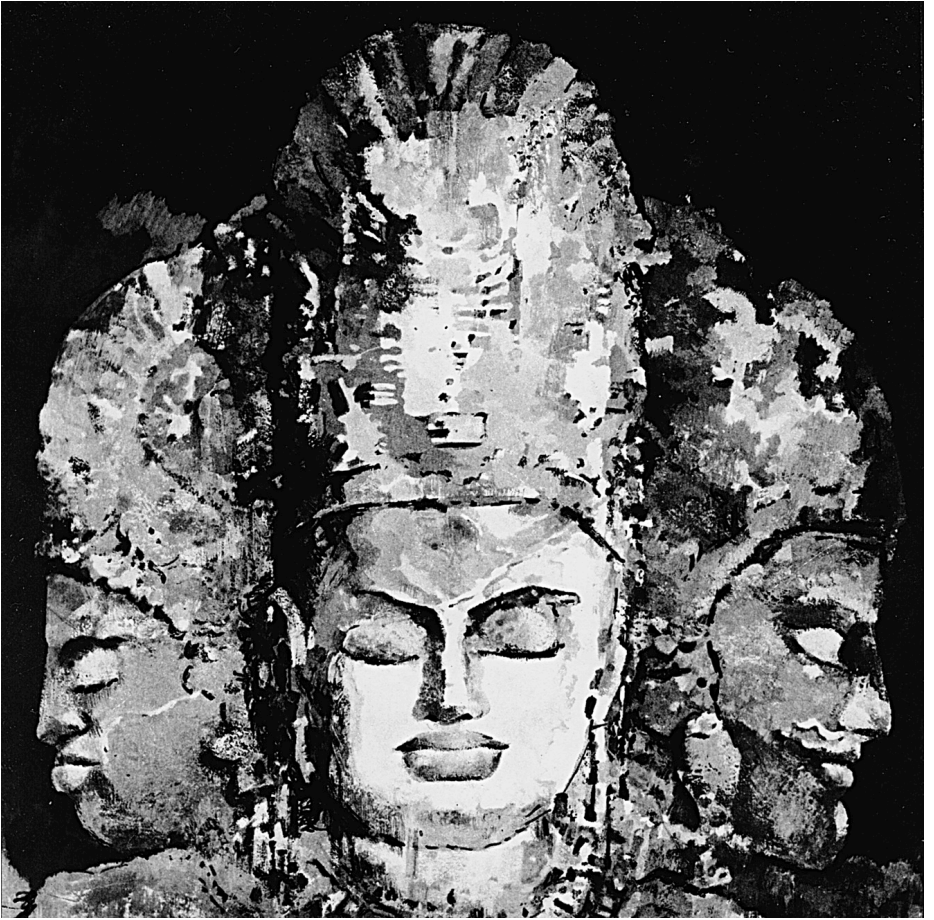
'n Voorstelling van die Hindoe drie-eenheid: Brahma die Skepper, Vishnu die Bewaarder and Mahesh die Geweldenaar.

Die menslike idees oor God is oud. Dit gaan terug na Nimrod en die Babiloniërs en dit is onverstaanbaar hoe dit later oorgeneem is deur die Christendom, alhoewel in 'n ietwat gewysigde vorm. Wie werklik verstaan wat hierdie beelde in doktrienes verteenwoordig, sal verstaan waarom 'n verduideliking aan die hand van die Skrif noodsaaklik is.