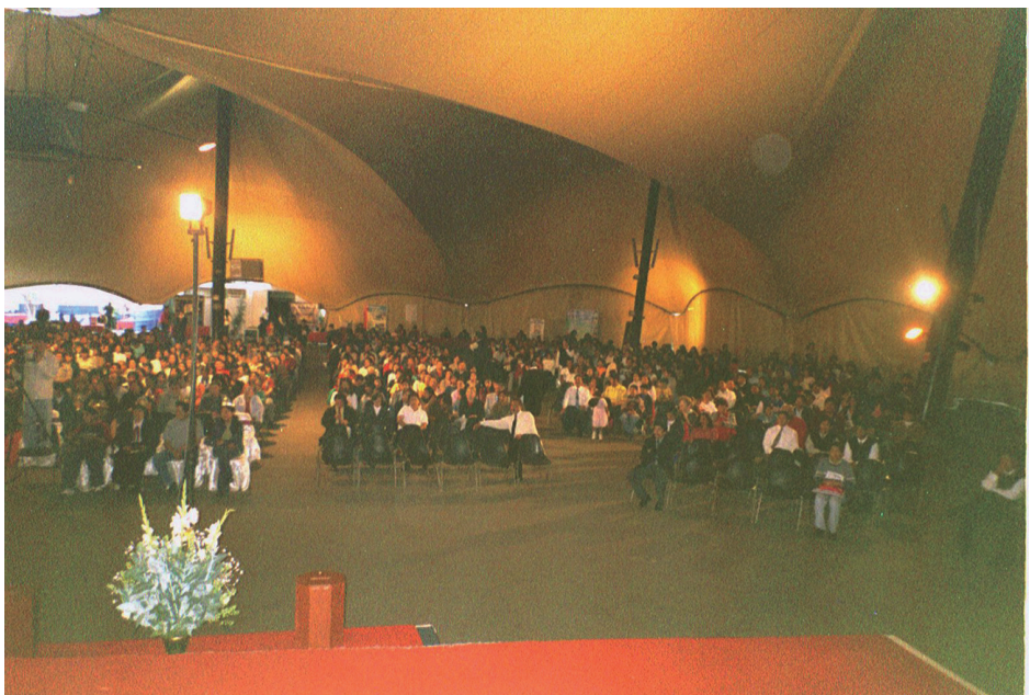
'n Foto van 'n byeenkoms in Lima, Peru, Oktober 2005