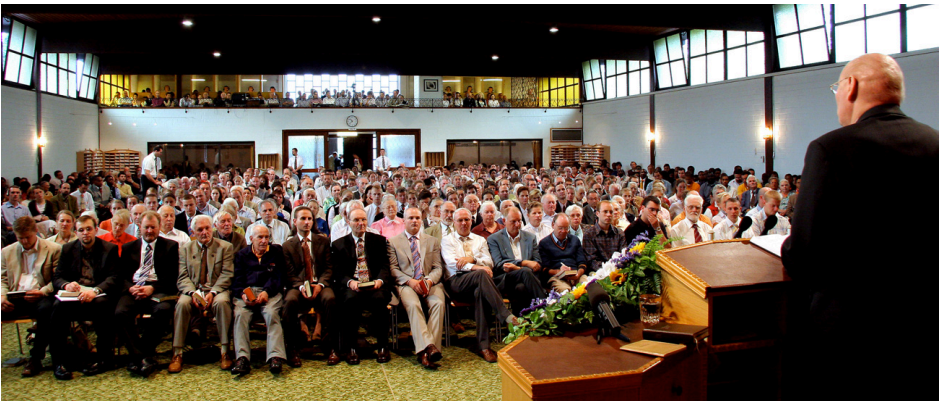
Foto van die byeenkoms van die eerste naweek van September, 2006, Broeders en sisters van regoor Europa kom maandeliks op die eerste naweek om die Woord van God te hoor. Die geestelike honger is tasbaar, terwyl die geestelike voedsel uitgedeel word.