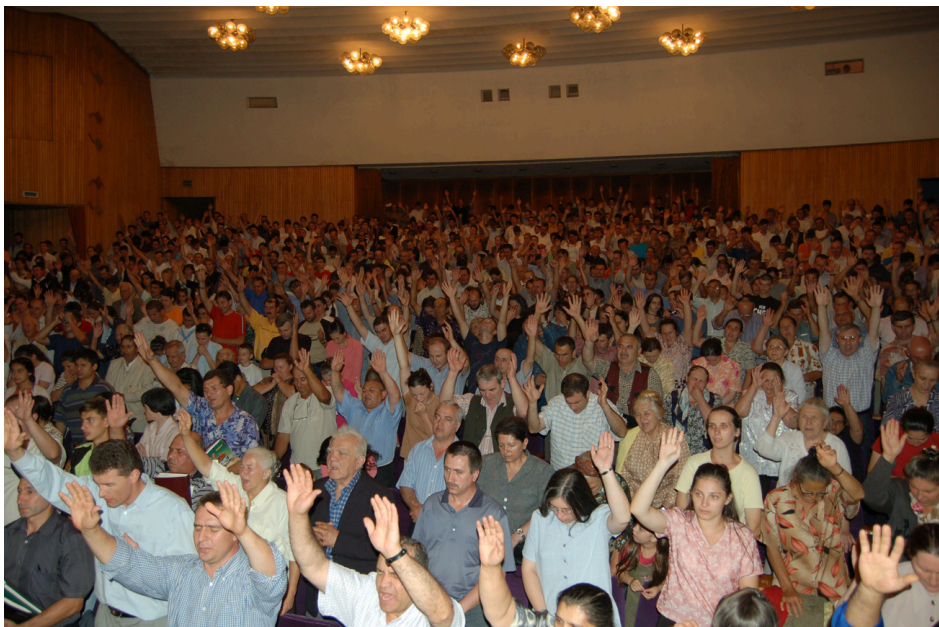
'n Byeenkoms in Augustus 2006, in Roemenië. In hierdie uitgawe kan ons slegs enkele van die vele foto's publiseer, wat ons van regoor die wêreld het. Die oes is groot.