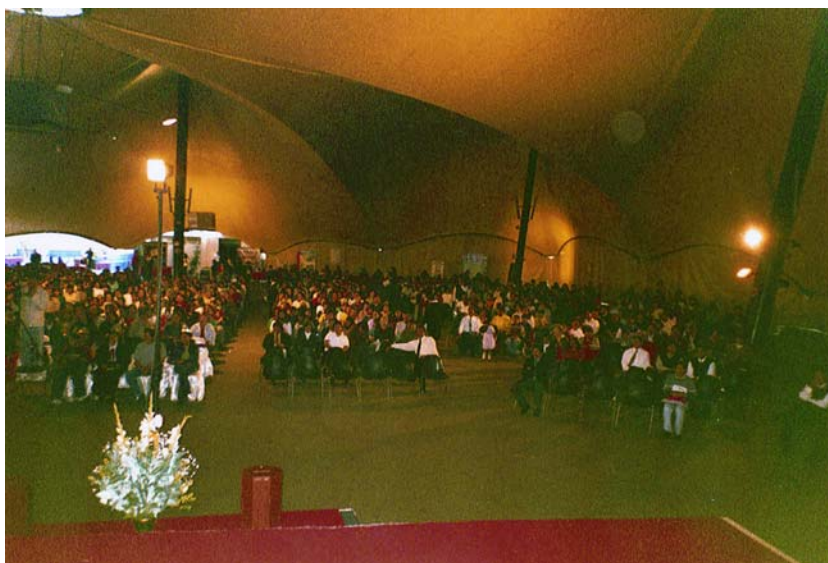
Adunare în Lima, Peru, octombrie 2005