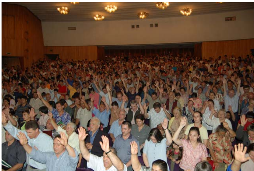
Adunarea din România, din august 2006. În această broșură putem publica doar câteva dintre multele fotografii pe care le avem din lumea întreagă.