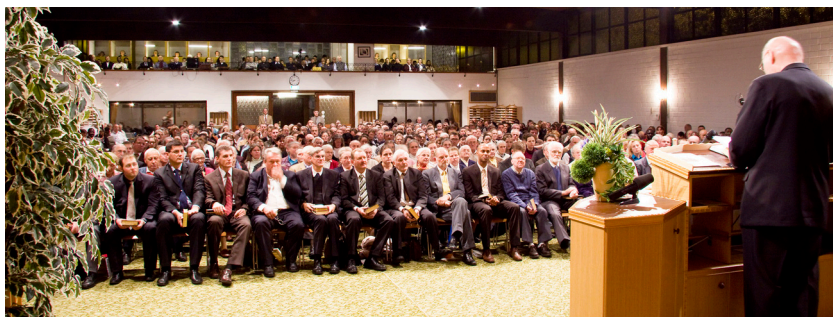
Shromáždění v Krefeldu v listopadu 2008