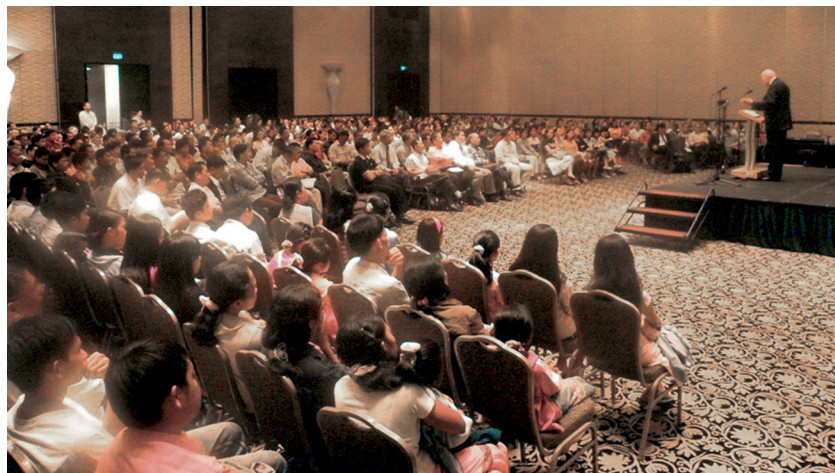
Shromáždění v Manile na Filipínách v září 2008.