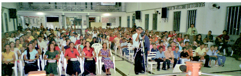
Shromáždění v Beelem v Brazílii v říjnu 2007