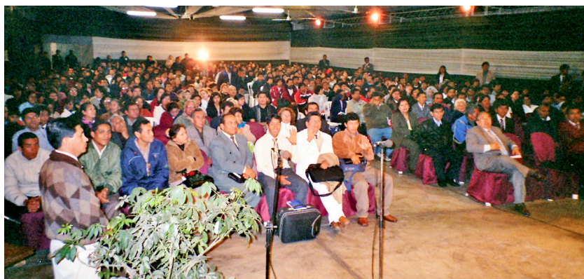
Shromáždění v Limě v Peru v říjnu 2007