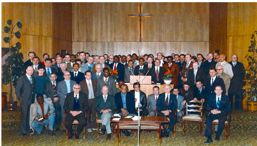
Mezinárodní konference v dubnu 1976, jíž se zúčastnili kazatelé z 33 zemí.