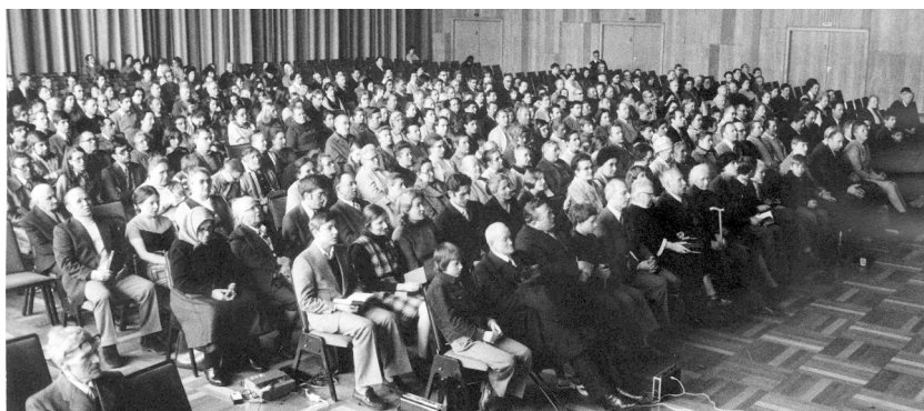
Shromáždění v Heilbronnu o velikonoční sobotě 1975