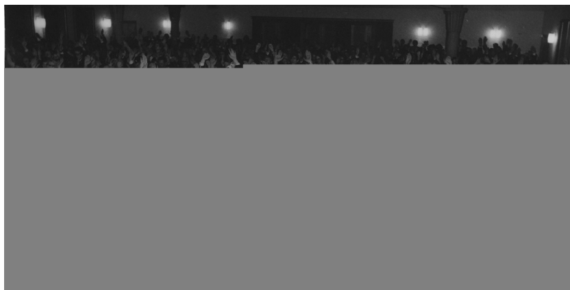
Shromáždění v Curychu o velikonoční neděli 1975