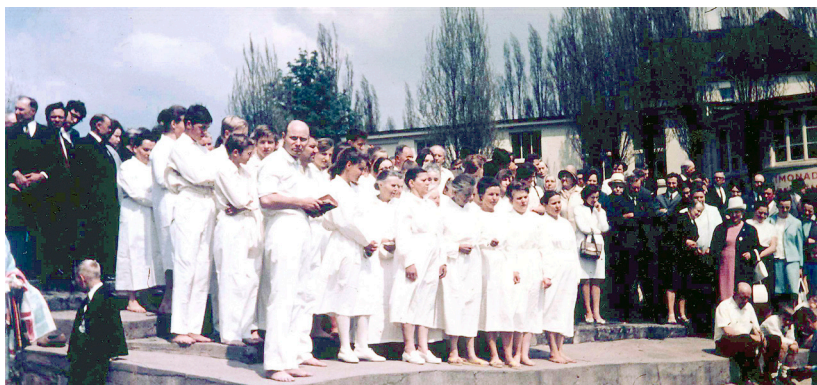
Od roku 1966 se tisíce bratří a sester dalo pokřtít na jméno Pána Ježíše Krista.